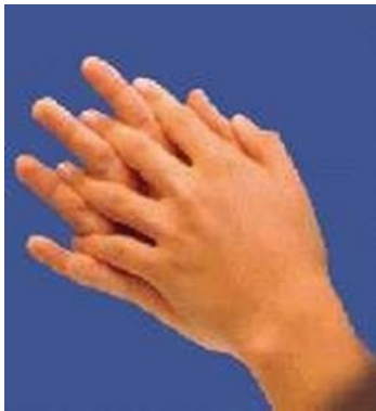
Palma com palma - espaços interdigitais