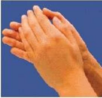
Palma com palma - toda a palma da mão