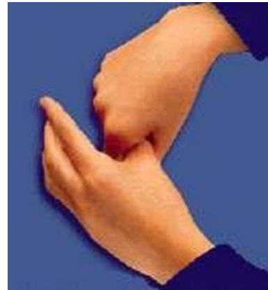
Rotação do espaço interdigital