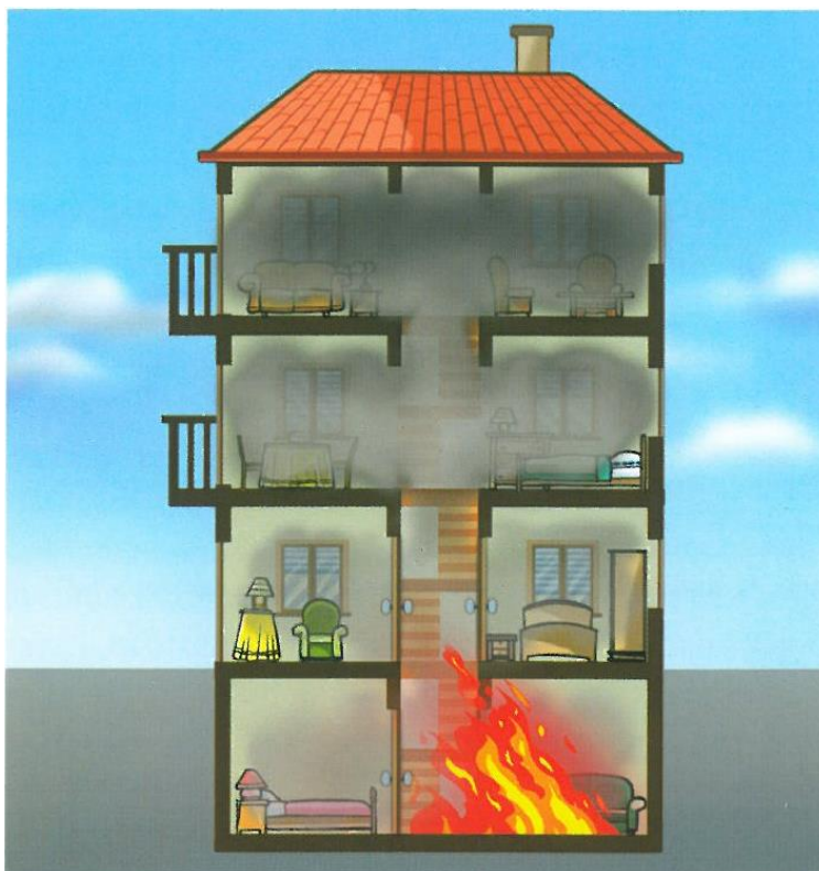
Figura n.º 3: Efeito cogumelo. (in “Ventilação tática” de Artur Gomes)

Quando a fenomenologia da combustão foi abordada, foi referido que as correntes de convecção encaminham os fumos e gases quentes para locais mais elevados, tais como tetos e coberturas, ficando concentrados. Nestes casos, quando o calor, os fumos e os gases quentes acumulam-se nos locais mais elevados e começam a espalhar-se lateralmente, envolvendo outras áreas, produz-se o que se designa de efeito cogumelo, como se pode observar na figura seguinte.