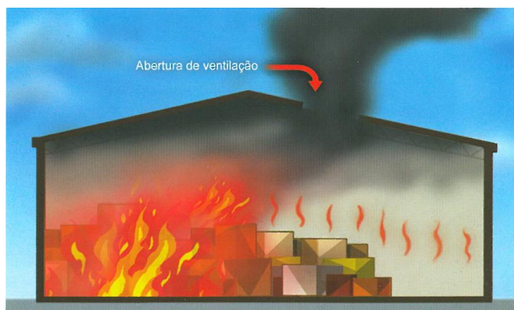
Figura n.º 2: Consequência de uma abertura fora da vertical do foco de incêndio. (in “Ventilação tática” de Artur Gomes)

Caso seja aberto um vão que não se encontre próximo do foco de incêndio, podem estar criadas as condições para o aumento da propagação do incêndio, pela deslocação horizontal dos produtos da combustão até à vertical da saída, como se pode observar na figura abaixo.